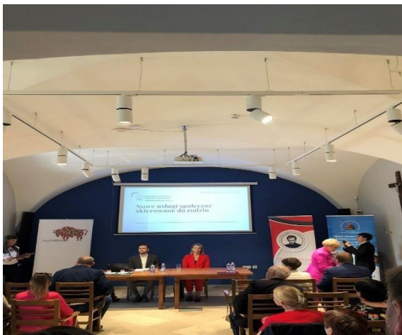
Przedstawiciele Ministerstwa Rodziny, Prac i Polityki Społecznej